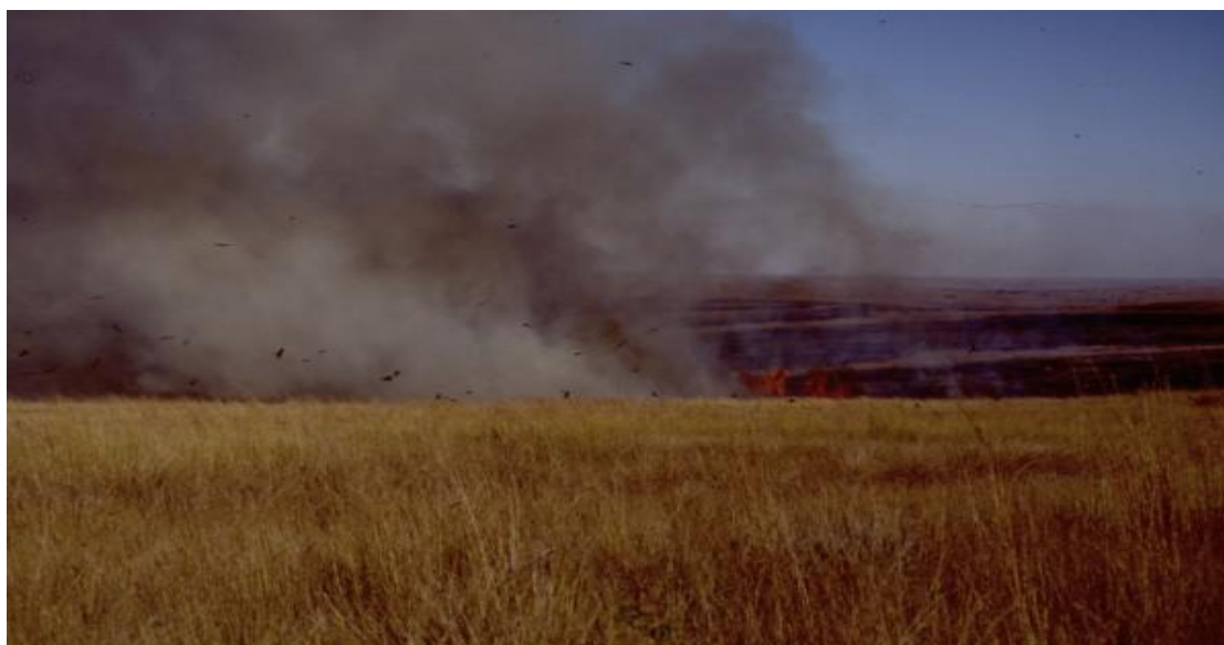
Figure 2: Pratique des feux dans les savanes de l'Horombe à Madagascar

Les types de *SP* précités sont extensifs et exigent la pratique des feux courants pour favoriser les repousses herbacées et limiter l'embroussaillage, tels qu'illustrée à la figure 2 . Le fonctionnement pastoral traditionnel est aussi pratiqué en zone semi-aride et il est soumis à un régime foncier communautaire.